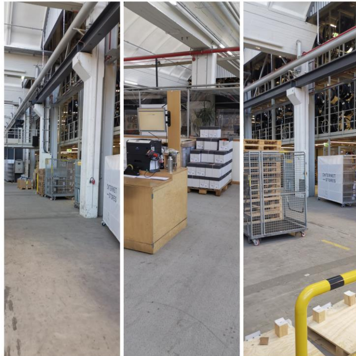
Skladišče iz različnih zornih kotov